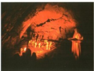
L'Inferno di Dante Grotte di Pertosa