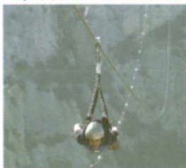
Il Voio dell'Angelo Pietrapertosa-Castelmezzano