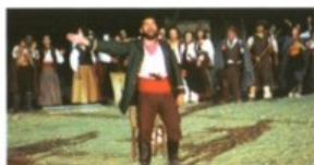
La Storia Bandita Parco della Grancia